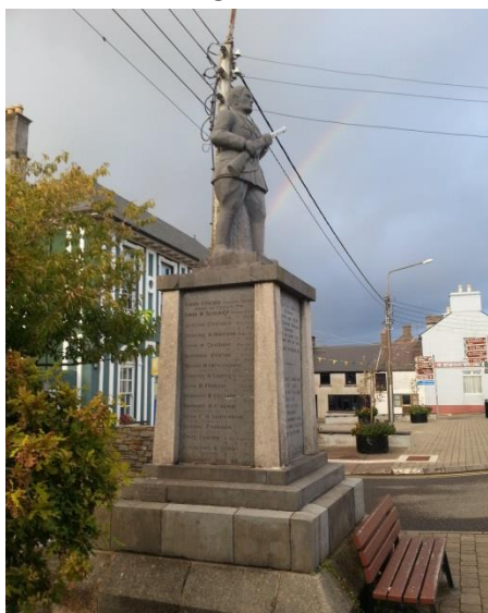
Herdenkingsmonument voor de Ierse Onafhankelijkheidsoorlog in Cahirsiveen, County Kerry

Op wandelreis in het prachtige Kerry werd ik onvermijdelijk om de haverklap geconfronteerd met grafmonumenten en gedenkstenen die getuige zijn van de eeuwenlange en bloederige Ierse emancipatiestrijd. Voorvechters van de Ierse hang naar onafhankelijkheid als Eamon De Valera of Michael Collins zijn bij de meesten dan ook gekend. Ietwat onderbelicht in onze contreien is echter de in Ierland legendarische Daniel O'Connell (Dónall Ó Conaill in het Iers Gaelic). Bijgenaamd "The