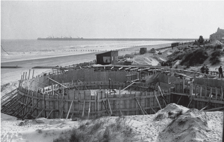
August 1942

Een bunker van de Atlantikwall in aanbouw, augustus 1942 (Bundesarchiv Duitsland).