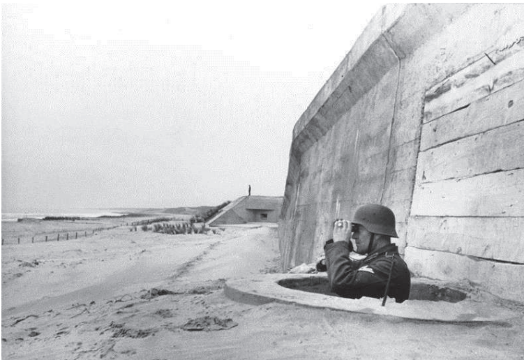
1944 Anfang

Bij de onderzochte aannemers is het opvallend dat slechts iets meer dan de helft het beroep reeds voor de bezetting uitoefende. In de andere gevallen was er sprake van een transformatie van onderneming en dus van opportunisme. De ondernemers die veranderden van stiel, deden dit meestal uit financiële overwegingen; slechts in enkele gevallen waren er ideologische elementen mee gemeoid.