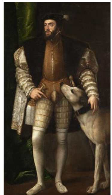
Karel V en zijn hond, een schilderij van Jakob Seisenegger uit 1532