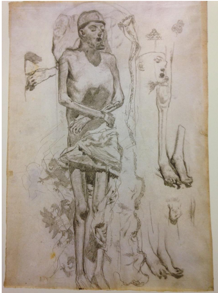
Mummie van Karel V, schets door Rico de Ortega, 1872, tekening in het STAM, Gent